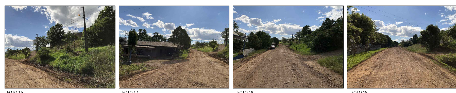
PLANIMETRIA ESCALA: 1/500